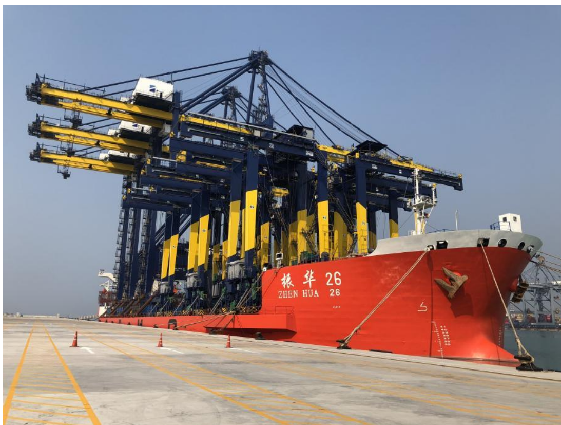
中国港湾承建泰国廉查帮港三期 D 区集装箱码头项目

在轨道交通装备合作方面，中车长春轨道客车股份有限公司累计向泰国出口地铁车辆164辆，铁路客车115辆，实现销售收入超3亿美元。