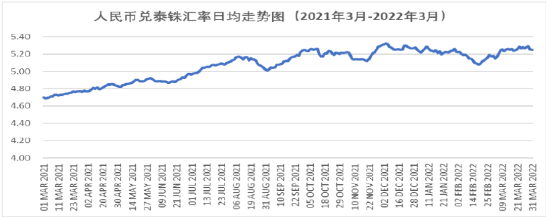
图4-2 人民币兑泰铢汇率变化趋势