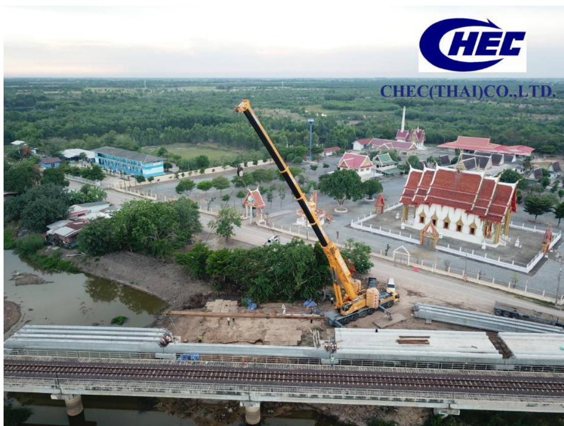
中国港湾（泰国）有限公司

中泰铁路项目是中泰两国政府间合作项目,2014年12月19日,中泰两国政府签订《关于在泰国2015年至2022年交通基础设施发展战略框架下开展铁路基础设施发展合作的谅解备忘录》,宣布共建中泰铁路;2015年12月19日两国在曼谷举办启动仪式,2017年12月正式破土动工。项目采用中国技术设计建造,分两期执行,一期为曼谷—呵叻段(约253公里),二期为呵叻—廊开段(约354公里)。