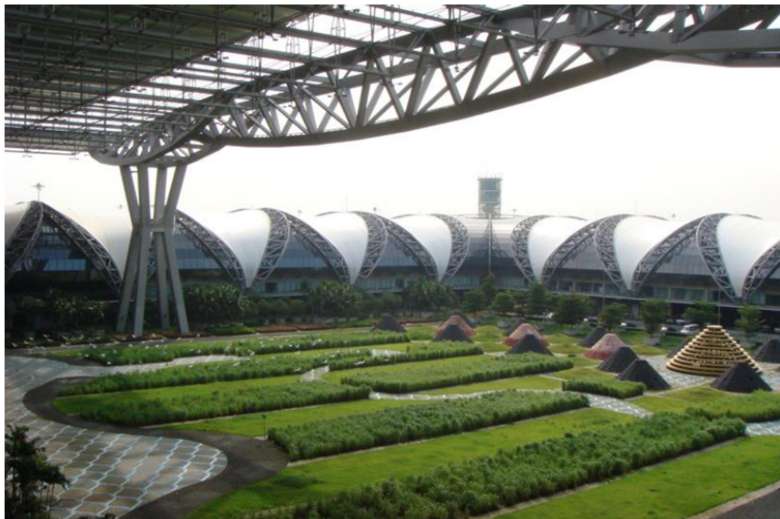
曼谷素万纳普国际机场

泰国航空业比较发达。航空客运已成为外国游客入境泰国的主要运输方式，乘飞机入境泰国的外国游客人数占入境泰国的外国游客总人数约80%。在货物运输方面，由于航空货运的费用较高，航空货运总额仅分别占国内货运比重和国际货运比重的0.02%和0.3%。