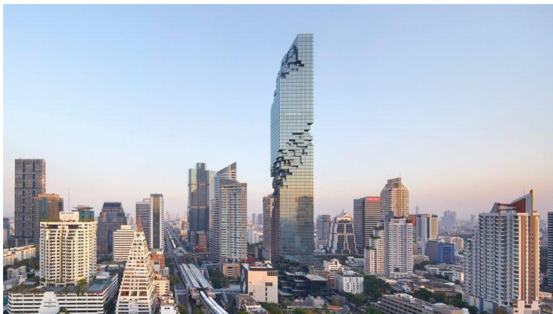
泰国最高建筑曼谷大都会大厦

首都曼谷位于湄南河畔，面积1569平方公里，人口约553万（截至2021年12月31日）。曼谷是泰国最大城市、东南亚第二大城市，也是泰国政治、经济、文化、交通中心。