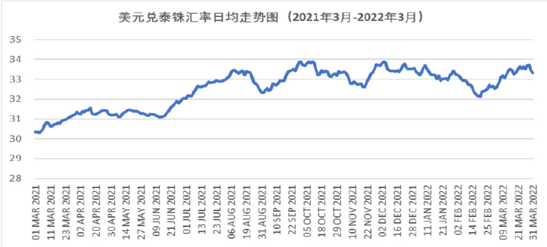
图4-1 美元兑泰铢汇率变动趋势